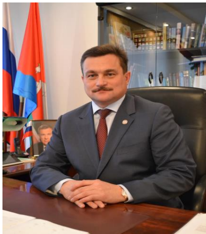
Зиатдинов Марат Галимзянович Глава Верхнеуслонского муниципального района Республики Татарстан